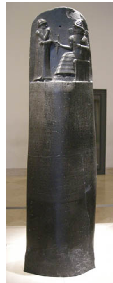
Código de Hammurabi. Museo del Louvre

“si un medico cura hueso fracturado de un hombre o cura una víscera enferma, el enfermo le pagara cinco siclos de plata. Si se trata de un liberto, este pagara tres siclos de plata. Si se trata de un esclavo el amo del esclavo dará al medico dos siclos de plata”