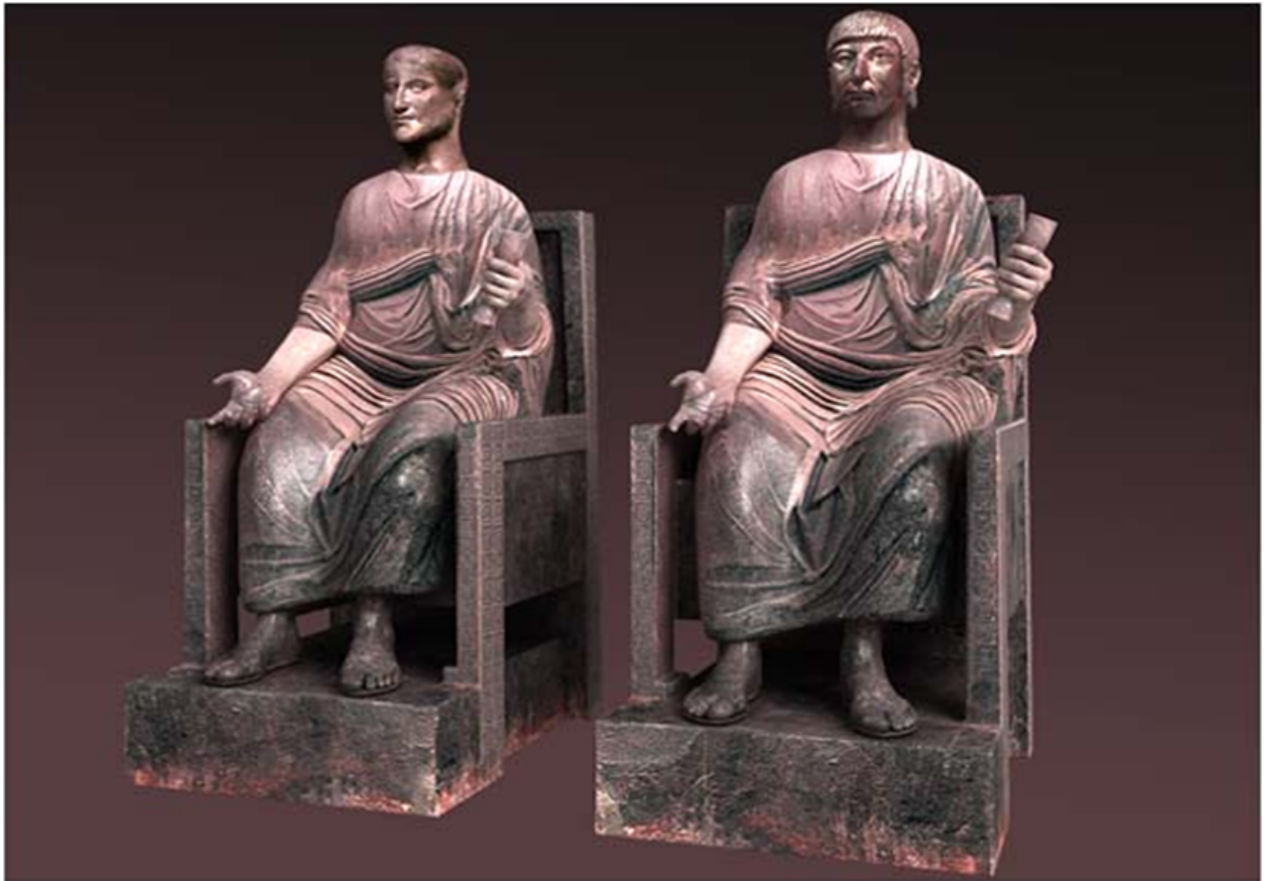
Reconstrucción de las esculturas de Constantino y Constancio Cloro sobre dos tronos que se encontraba en la plaza del Philadelphion de Constantinopla.

El material más utilizado para las tumbas de los emperadores fue, al igual que para las esculturas y monumentos repartidos por la ciudad, el mármol de pórfido, al menos para los primeros sucesores de Constantino. En la actualidad solo se conservan diez ataúdes de pórfido en Estambul, de los que no podemos saber cuál sería el del emperador. Todos presentan un aspecto parecido: cajas cuadradas con pocas decoraciones; los elementos ornamentales más destacados serían el alfa y el omega que se encuentran en las tapas de casi todos los ataúdes bizantinos. Autores como Neslihan Asutay-Effenberger y Arne Effenberger han afirmado recientemente que la tumba de Constantino sería la más grande de las que se conservan, antes adjudicada a Juliano, con una forma cilíndrica similar a la de los sarcófagos de los faraones egipcios. 77 Según Jonathan Bardill el sarcófago de Constantino es el que se encuentra en Santa Irene: de todos los encontrados es el único decorado con un ankh egipcio, símbolo pagano y cristiano a la vez