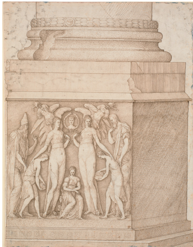
Ilustración de los bajorrelieves de la columna de Constantino por Melchior Lorck.