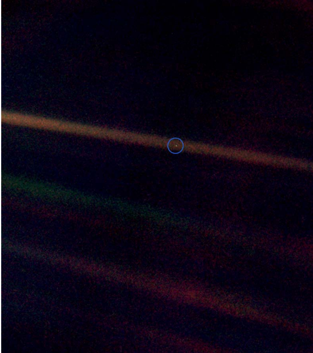
Figura 1. Imagen de la Tierra captura desde la sonda Voyager-1 (primera fotografía tomada del Sistema Solar).