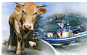
Conserjería de Ganadería, Pesca y Desarrollo Rural.