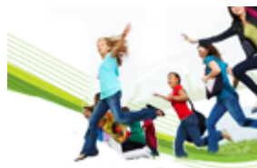
Conserjería de Educación, Cultura y Deporte.