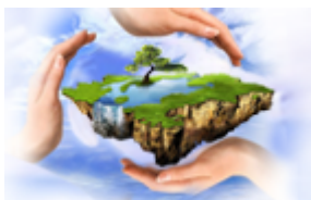
Conserjería de Medio Ambiente, Ordenación del Territorio y Urbanismo.