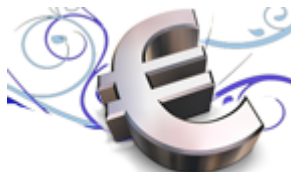
Conserjería de Economía, Hacienda y Empleo.