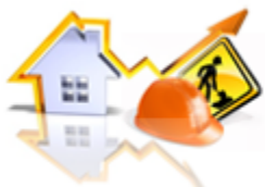
Conserjería de Obras Públicas y Vivienda.

Analicemos la estructura de los departamentos y funciones del Gobierno de Cantabria :