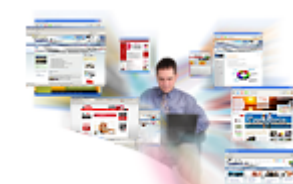
Conserjería de Innovación, Industria, Turismo y Comercio.