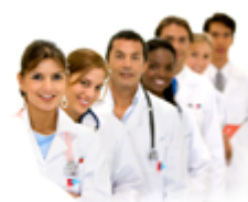
Conserjería de Sanidad y Servicios Sociales.