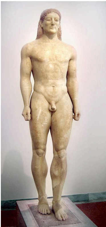
Figura 2: Kuros de Anavissos. ca. 530 a.C. Museo Arqueológico Nacional de Atenas.

A diferencia de lo que ocurrió en Esparta, ninguna población del Ática pasó a depender de los atenienses ni a tener un status diferente: todos fueron considerados por igual ciudadanos de Atenas. A diferencia también de Esparta, cuyo sistema socio-político desde la época arcaica tendió a fosilizarse y a no evolucionar, en Atenas los cambios políticos se sucedieron. Varios dirigentes desde Solón emprendieron reformas que a la larga condujeron a la instauración de un sistema de gobierno democrático, plenamente conformado en época clásica.