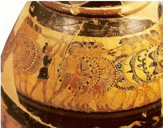
Figura 1: "Vaso Chigi". Olpe donde aparece representado un combate de hoplitas. Ca. 640-630 a.C. Museo Nacional Etrusco de Villa Giulia (Roma).

El nacimiento de la polis es sin duda uno de los fenómenos más característicos de la Grecia arcaica. Esta forma de organización política, sin embargo, no fue propiamente una innovación griega, ni se aplicó de forma generalizada en toda la Hélade. En muchas zonas, sobre todo en aquellas menos desarrolladas y apartadas, no hubo póleis , sino que el pueblo ( ethnos ) siguió siendo la única realidad político-territorial. Es el caso de las regiones situadas en el oeste y norte de la Grecia continental europea, como Macedonia, Tesalia, Epiro, Acarnania y Etolia; y lo mismo cabe decir de la Arcadia y Acaya, dentro del Peloponeso.